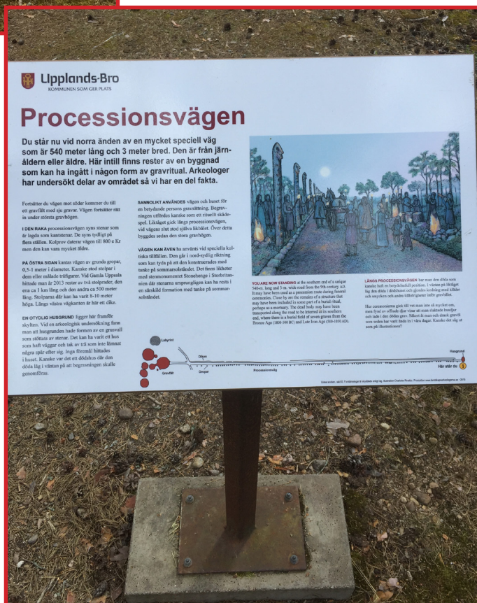
Vid Rösaring i Upplands Bro har kommunen låtit producera informationsskyltar vid bland annat processionsvägen till Rösaring.