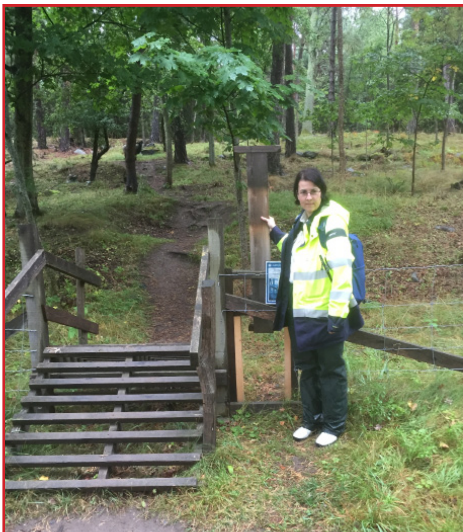
Ett välbesökt fornminnesområde i Järfälla har intill färisten en extra öppning så att kopplade fyrbenta kompisar kan passera stängslet.

En särskild satsning måste inför kommande säsonger riktas mot de tidigare ej anslutna kommunerna. Detta har påbörjats men svårigheter finns att hitta rätt kontakter. Ett särskilt projekt kommer att gälla Stockholms stad. Eftersom kunskapsseminarium har genomförts med gott deltagande från stadsdelsförvaltningarna kan möjligen detta underlätta en ansträngning att få med det 30-tal objekt som finns i kommunen. Även Djurgårdsförvaltningen kommer att kontaktas då mycket finns att förbättra vad gäller till exempel Djurgårdens objekt.