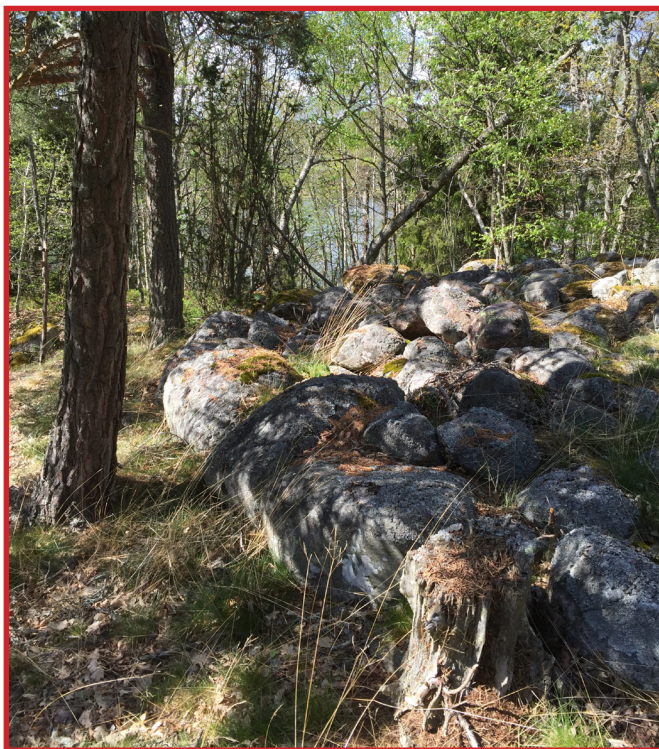
Ett relativt avlägset gravfält i Evlinge på Värmdö med fina konstruktionsdetaljer får kanske vänta en tid innan det kan åtgärdas. Första prioritet är någorlunda centralt belägna fornvårdsobjekt.

Genom de kommuner som anslutit till det nya länsstyrelseprogrammet och som jag har haft kontakt med vårdas nu omkring ett 150-tal objekt. Det är förstås en mycket ungefärlig siffra eftersom all vård inte sker samtidigt. I själva verket har jag besökt och aktivt i fält diskuterat mellan 90-100 objekt. Efter samråd i ytterligare kommuner finns planerat åtminstone för närmare 30 fler vårdobjekt. Dessa har emellertid inte hunnits med fältbesiktning i år utan måste vänta till kommande säsong. Det gäller Vaxholm, Huddinge, Solna, Nykvarn.