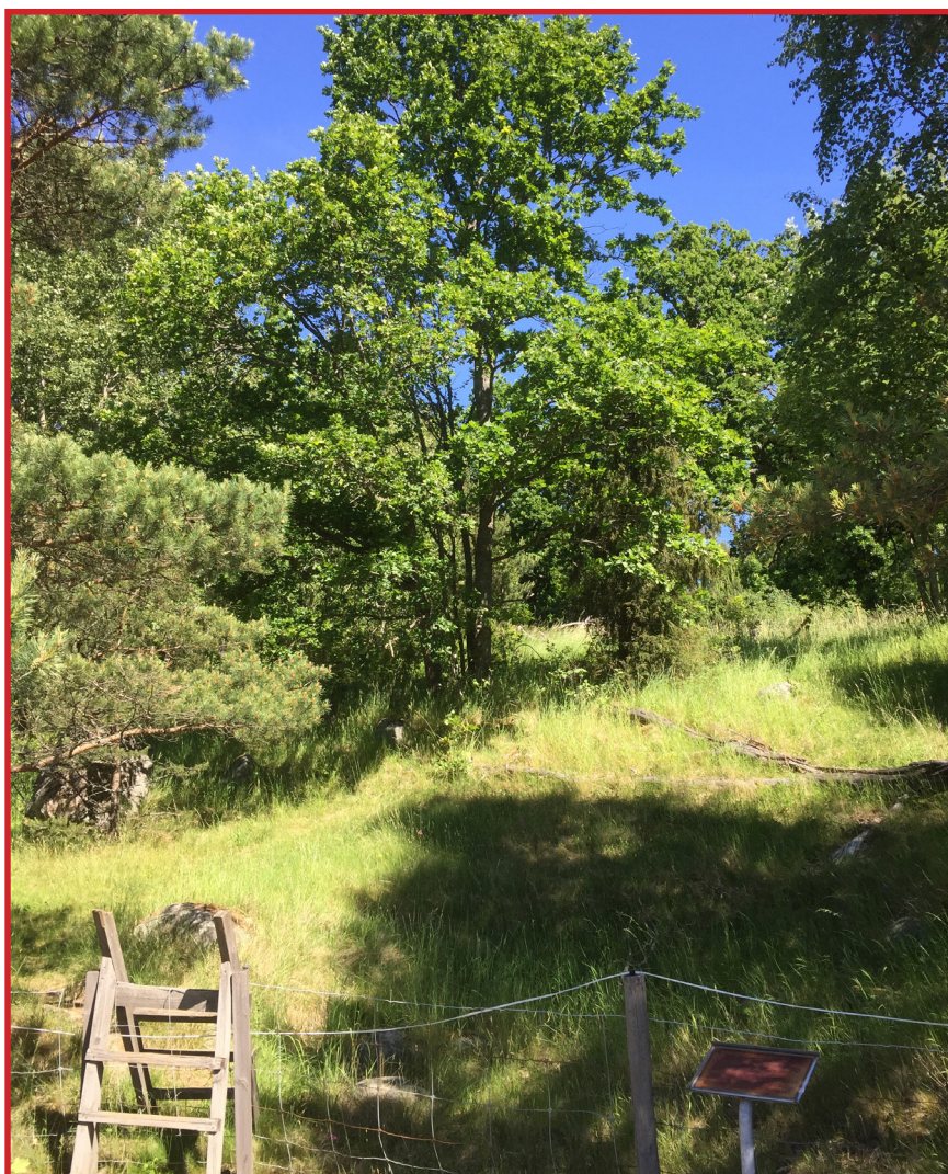
En av solstrålning sönderbränd informationsskylt, svajigt stängsel och osäker stätta leder in till ett igenväxt gravfält i Bergaholm i Salems kommun. Allt kommer att vara åtgärdat till nästa säsong!

Det är dock inte så att det alltid krävs borttagande av träd som växer på fornlämningar. I fall där stort ytligt slitage pågår genom hårt brukade stigar, lekområden osv kan man se hur